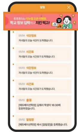
200만원 / 2주 앱 알림 탭 상단에 노출