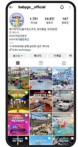
120만원/1회 애기야가자 공식 인스타그램 피드내 홍보 게시물 업로드