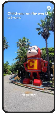
700만원/2일 앱 접속시 풀스크린 노출