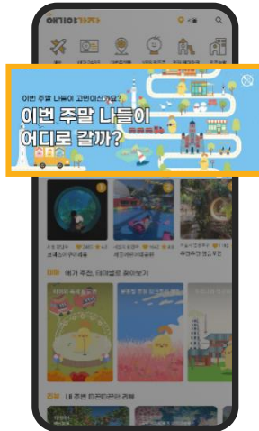
250만원/1주 홈 최상단 아웃링크 지원 배너 노출