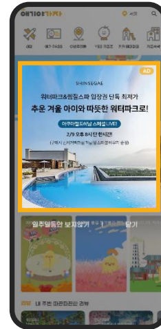
150만원/1일 300만원/3일 앱 실행시 홈 화면 전면 노출