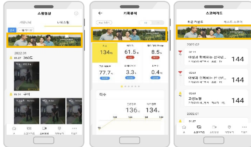
최대 6구좌 랜덤 노출 (500만원/월) 예상 노출량 90만~100만