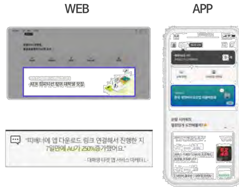
최상단 배너 광고 앱 추천 화면 전체 VIEW(제1면) 노출 180만원 / 5일